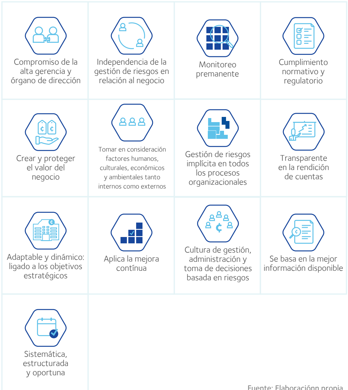
Esquema N°4 Principios de Gestión