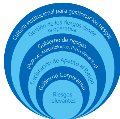
Esquema N° 2 Marco de Gobernanza de riesgos