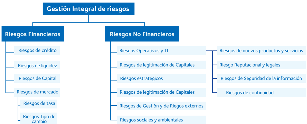
Esquema N° 3 Riesgos Objeto de Gestión

Dado que la principal actividad económica se centra en la controladora del grupo, siendo ésta una cooperativa dedicada a la captación de ahorros y el otorgamiento de préstamo a sus asociados, los riesgos que han sido declarados como principales obedecen a riesgos con impacto financiero, segregados en riesgo crédito, riesgos de liquidez, riesgos de capital, esto claro, sin dejar de lado una serie de riesgos que, deben ser gestionados en forma oportuna a fin de evitar a la cooperativa exponerse a posiciones fuera de su apetito al riesgo. Cada uno de estos riesgos cuenta con sus respectivas políticas, metodologías de cálculo, seguimientos y monitoreo.